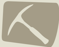
Usado em garimpos