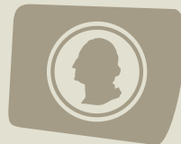
Moedas de ouro