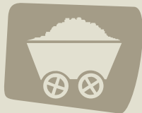
Usado em mineração