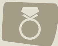
Jóias de ouro