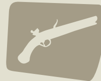
Relíquias antigas de ouro